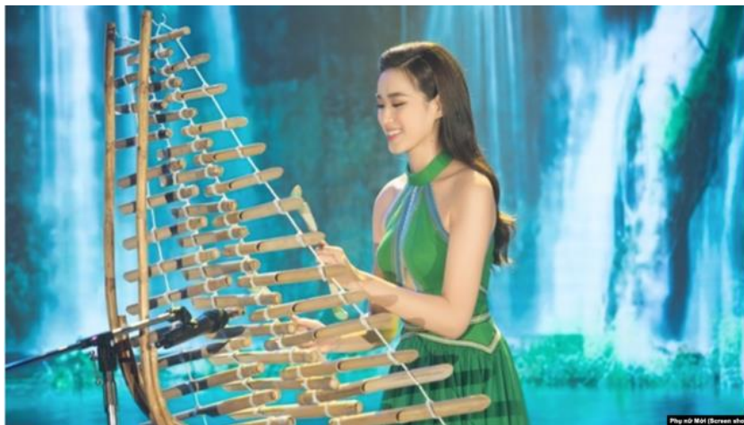
Hoa Hậu Việt-Nam Đỗ Thị Hà

Người ta còn nhớ trong cuộc thi Hoa Hậu Thế Giới năm 2021 tại Puerto Rico, cô Đỗ Thị Hà đại diện cho Việt-Nam Cộng-Sản đã trình bày bản nhạc “Cô Gái Vót Chông”. Dư luận đã lên tiếng chỉ trích việc dùng một bản nhạc sắt máu, trong thời chiến tranh Việt-Nam có quân đội Hoa-Kỳ tham chiến, tại lãnh thổ của Mỹ trước hàng ngàn khán giả người Mỹ.