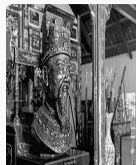
Đình thờ danh tướng Thoại Ngọc Hầu Tại Núi Sập, An Giang