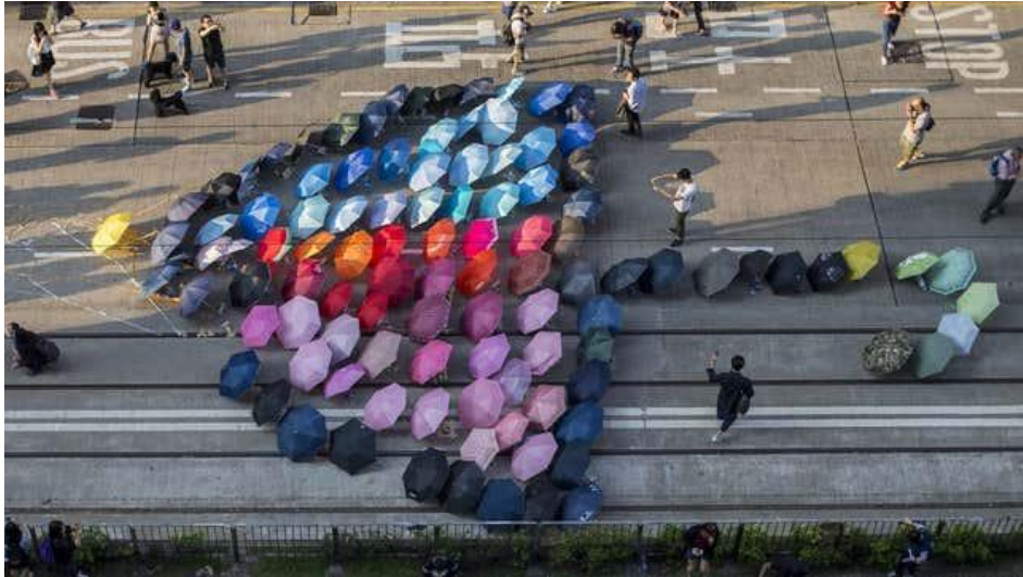
Biểu tình dù ở Hồng-Kông

Năm 1997, Anh trao trả Hồng-Kông lại cho chính quyền Trung-Quốc với sự cam kết của Bắc-Kinh là Hồng-Kông được tự trị 50 năm.