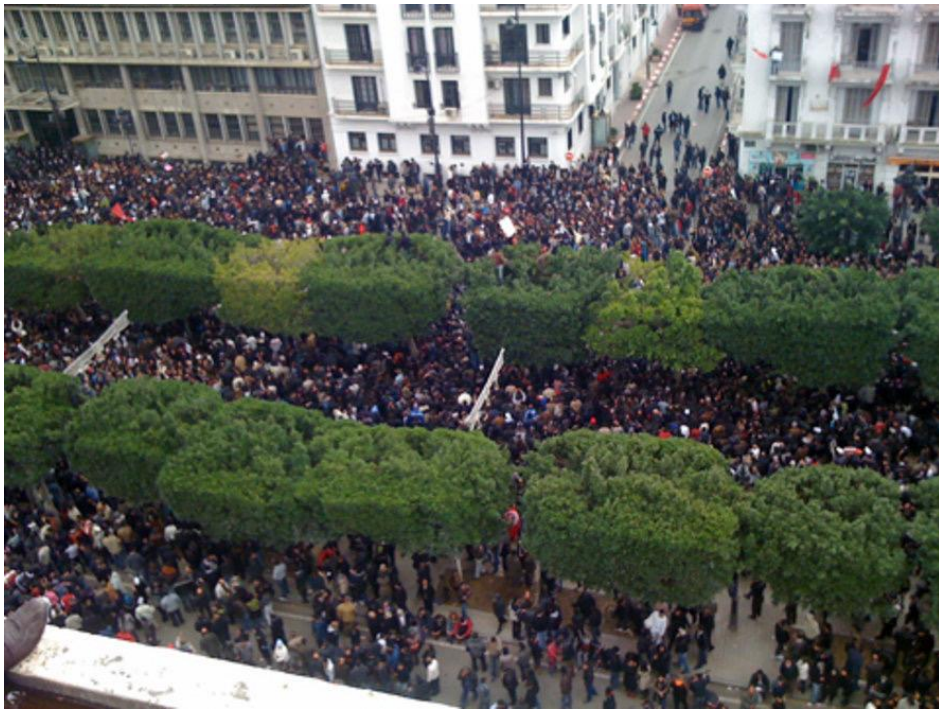
Biểu tình ở Tunis, Tunisia