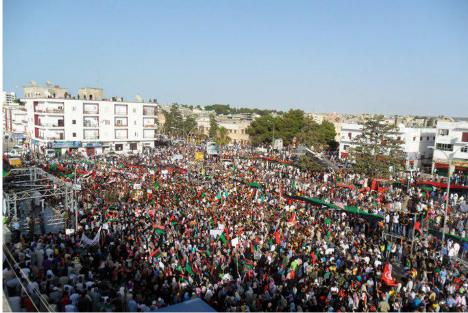
Biểu tình ở Cairo, Ai-Cập