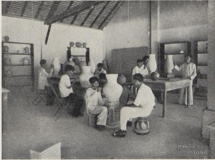
ÉCOLE D'ART DE BIEN-HOA. — L'ATELIER DE DÉCORATION DES VASES.