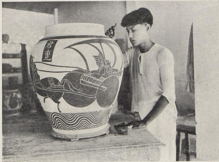
ÉCOLE D'ART DE BIEN-HOA. — PEINTURE D'UN GRAND VASE DE STYLE CHINOIS CLASSIQUE.