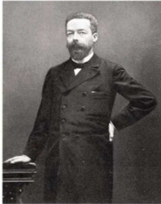
Paul Doumer (1857-1932)