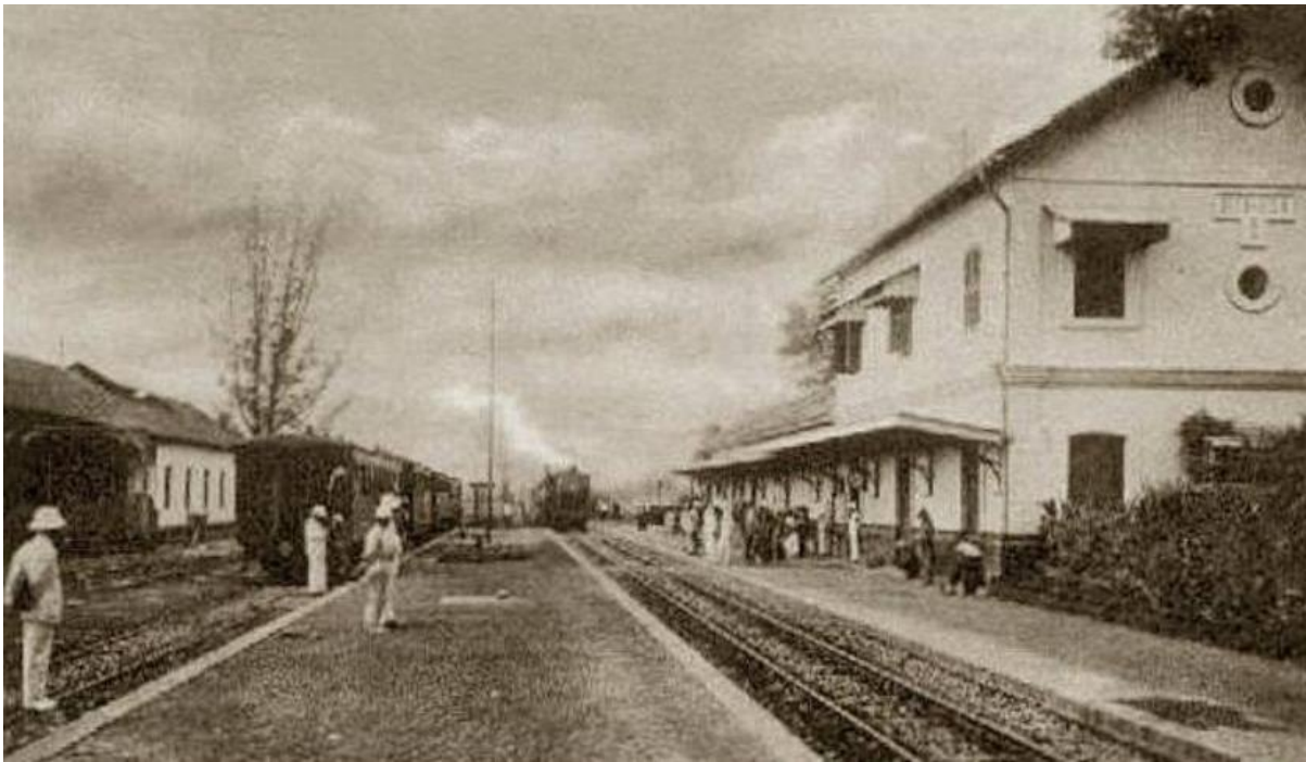
Ga Xe Lửa Biên-Hoà