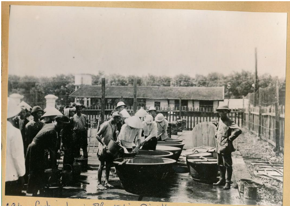
AgH - Cochinchine - Plantation Bien Hoa - Surannah - Aréas - Filtrage du latex -