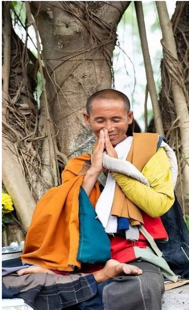
Thầy Thích Minh Tuệ

Chúng ta ai cũng biết, Thích Trí Quang là đảng viên cộng-sản đội lốt thầy tu xâm nhập vào Giáo-Hội Phật-Giáo Việt-Nam Thống-Nhất để xúi giục phật tử chống lại chế độ, làm rối loạn hậu phương Việt-Nam Cộng-Hòa để làm suy yếu cuộc chiến tự vệ của quân dân miền Nam.