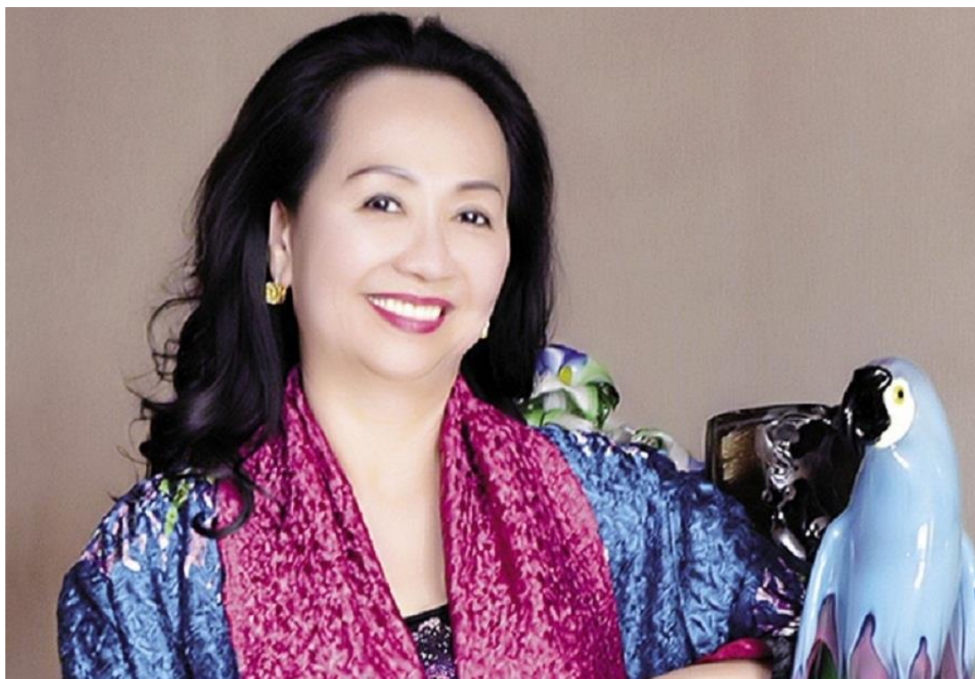
Trương Mỹ Lan, chủ tịch tập đoàn Vạn Thịnh Phát

Những tay gian thương như Phạm Nhật Vượng hay Trương Mỹ Lan nhìn xa thấy rộng, người chuyển đầu tư sang Singapore, Mỹ, kẻ kinh doanh dựa vào thế lực Trung-Cộng nhưng người ta nghĩ họ khó thoát khỏi bàn tay cộng sản Việt-Nam.