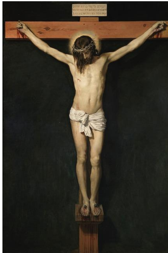
Chúa Giê-Su bị đóng đinh

Hội Ái-Hữu Biên-Hoà hân hạnh giới thiệu đến quý vị bài: Chúa Giê-Su Và Sự Thích Minh Tuệ của HCA . Hội chân thành cảm tạ giả. Kính mời. Trân trọng.