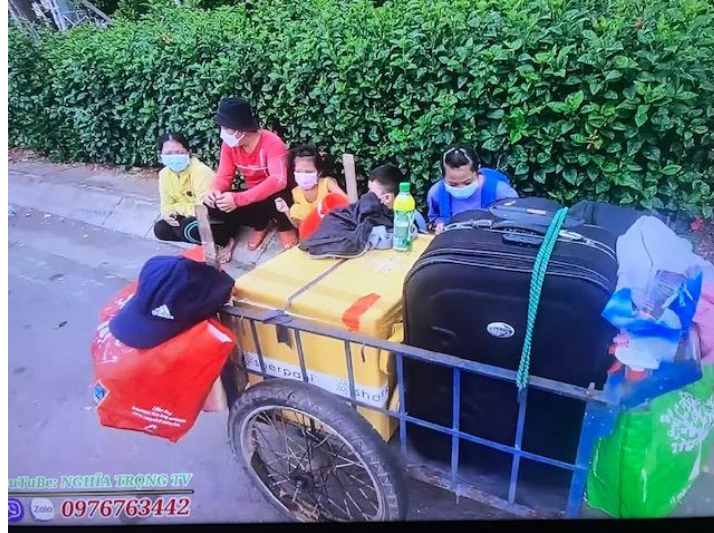
Gia đình đi xe ba gác về Cao-Lãnh

Một cặp vợ chồng khác với ba đứa con chắt nhau trên xe ba gác với đồ đạc.