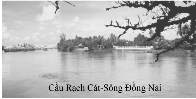
Cầu Rạch Cát-Sông Đồng Nai