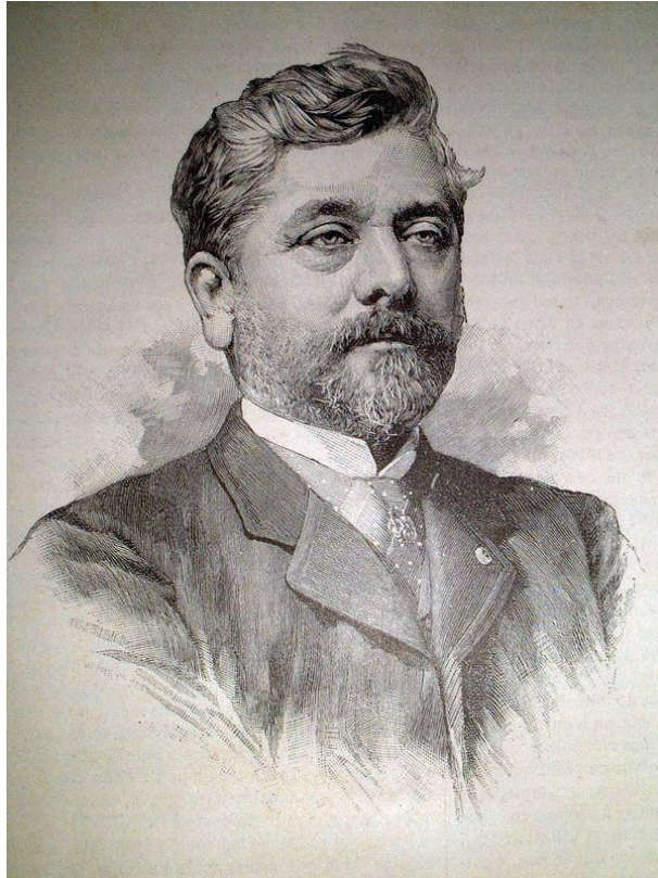
Kỹ sư Gustave Eiffel

Chính xác hơn thì theo tài liệu của nhà kỹ sư người Pháp Gustave Eiffel tác giả của 2 cây cầu Rạch-Cát (3 nhịp) và cầu Gành (4 nhịp) thuộc tỉnh Biên-Hoà (cầu được xây vào năm 1892).