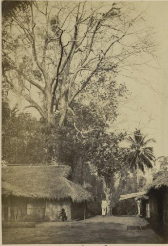
65 Cochinchine - Poste de Phuoc-Linh