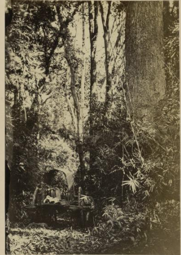
67 Route dans une forêt de Bien-hoa