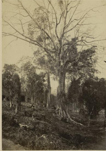
66 Route de Bien-hoa