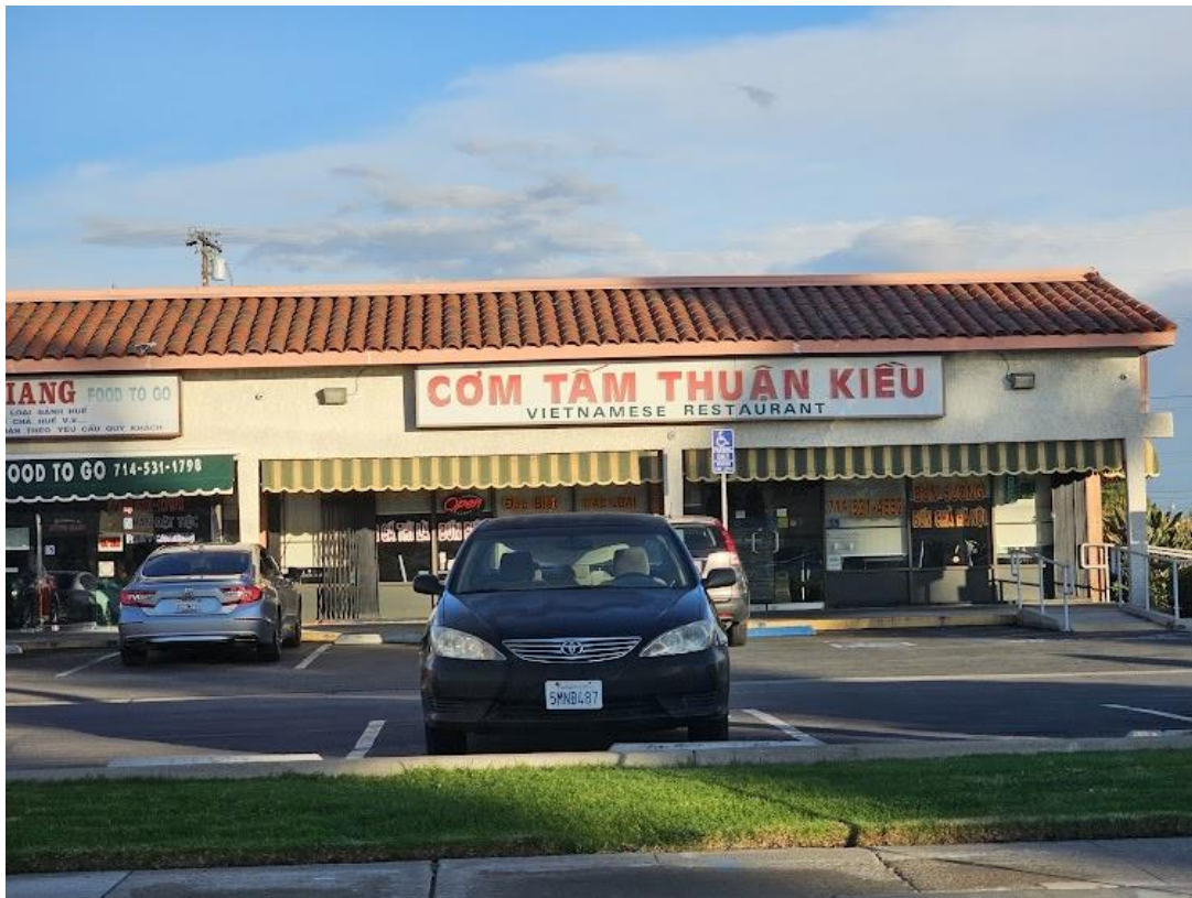
Quán cơm tâm Thuận Kiều ở Little Saigon

Một điều trớ trêu, khi đi trên các đường phố ở Việt-Nam, như là ở Sài-Gòn người ta nhìn thấy hầu hết các bảng hiệu của các cửa hàng đều viết bằng tiếng Anh. Nhìn quanh quất chung quanh người ta chỉ thấy người đi đường toàn là người bản xứ Việt-Nam, ít thấy hay có khi không thấy một người ngoại quốc nào cả.