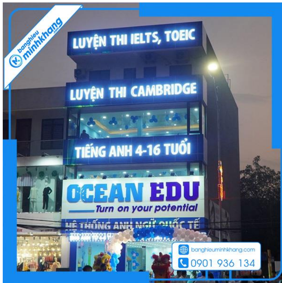
Trường dạy Anh ngữ ở Sài-Gòn