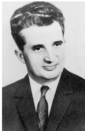
Nhà độc tài Ceaucescu

Thế giới không quên vợ chồng nhà độc tài Ceausescu bị xử bắn ngày 25 tháng 12, năm 1989 tại một khu quân sự ngoài thành phố Bucharest, và chế độ Cộng-Sản Roumanie (Romania) sụp đổ chỉ trong vòng không đến 1 tuần kể từ cuộc nổi dậy của người dân.