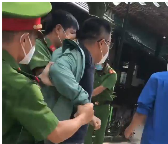
Công an bắt dân