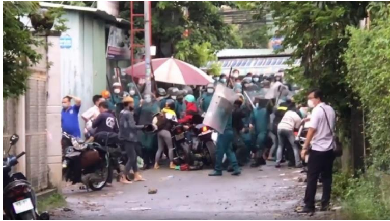
Xô xác giữa dân và cảnh sát cơ động

Nhìn cảnh tượng phi nhân đó, nước mắt tôi ràn rụa, thương cho những người dân vô tội đã bị thiên tai còn thêm nhân hoạ. Trên thế giới này chắc không nơi nào diễn ra thảm cảnh đó. Nhà nước Cộng-Sản nhứt định nhốt người dân đến đói chết hay sao mà không cho người ta con đường sống. Họ sẽ trả một giá đắt vì những điều họ gây ra.