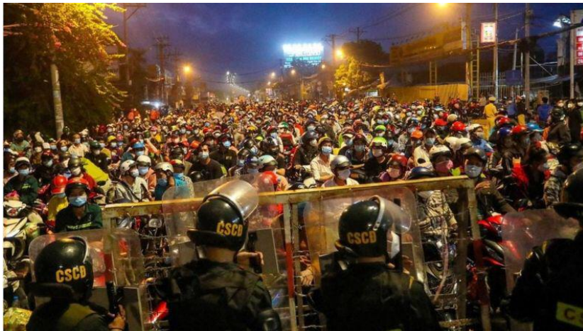
Người dân bị ngăn tại chốt chặn